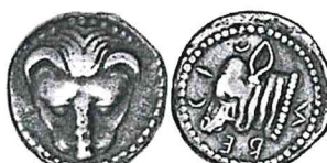
Rhegion 1 vittoria 1 Atleta