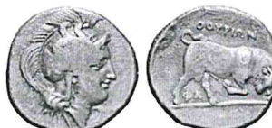
Thurii 4 vittorie 3 Atleti