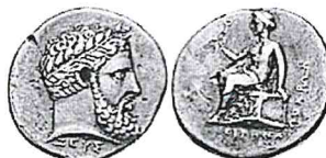
Lokoi Epizephiroi 7 vittorie 5 Atleti