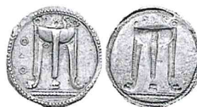
Kroton 50 vittorie 12 Atleti