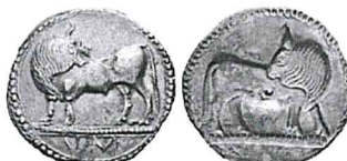
Sybaris 2 vittorie 2 Atleti