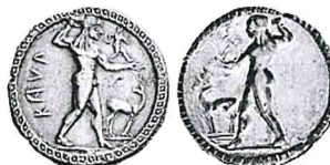
Kaulonia 1 vittoria 1 Atleta